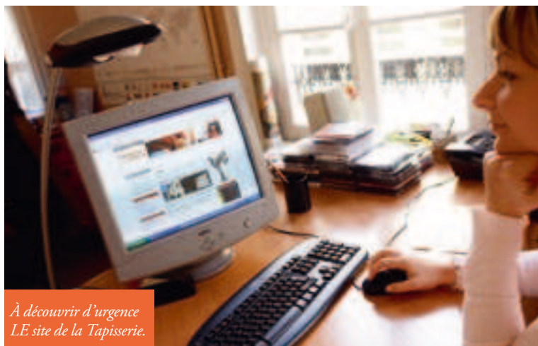
À découvrir d'urgence LE site de la Tapisserie.

La Ville de Bayeux vient en effet de mettre en ligne un site spécifique dans le respect de la charte graphique de celui de la mairie. Les informations sont regroupées autour de cinq thèmes : L'accueil revient sur l'actualité du musée ; Visiter permet à l'utilisateur de préparer à domicile sa visite avec les principaux axes du parcours muséographique et les détails pratiques (accès, horaires...), de faire un point sur les études et ouvrages en cours sur le chef-d'œuvre ; Étudier s'intéresse à l'approche pédagogique de la Tapisserie en donnant aux parents et aux enseignants des clés supplémentaires pour expliquer l'œuvre aux plus jeunes ; Événements renvoie aux animations proposées par le musée ;