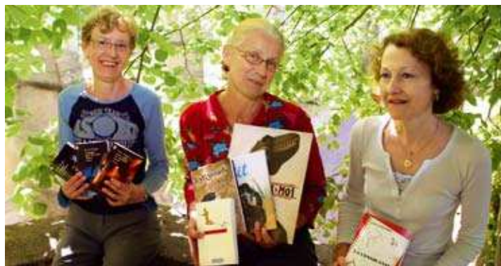
Des dinosaures, du frisson, de l'émotion : grâce aux bons conseils de la médiathèque, petits et grands trouveront, de quoi ravir leur été.

Les Déferlantes de Claudie Gallay plairont aux amoureux du Nord-Cotentin. À partir de témoignages des habitants, l'auteur offre une histoire poignante de personnages écorchés vifs. La nature, omniprésente, y est magnifiquement décrite.